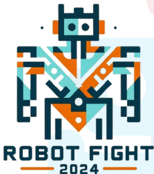
原 RobotFight 標誌